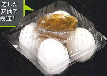
⑩ 4MMS温泉卵エコナ 26 MS~Mサイズ用