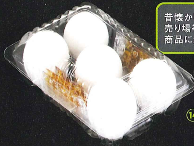
⑬ 4MMS源N付 MS~Mサイズ用